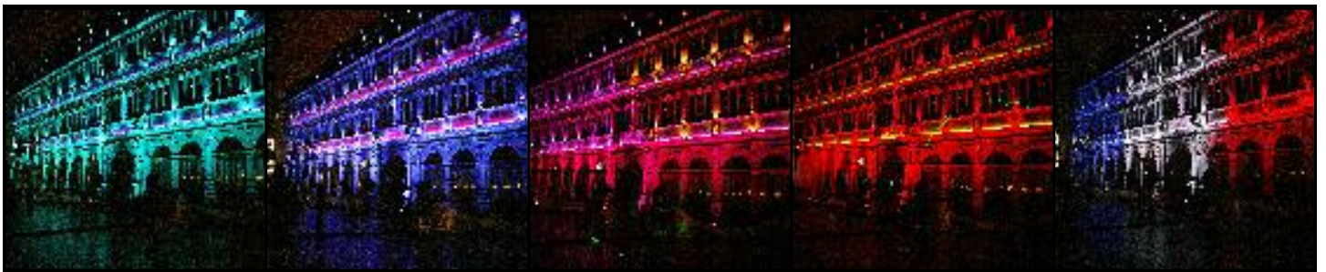
Eclairage en Led de la CCI (Strasbourg)

Idéale pour l'éclairage architectural, la Led trouve également sa place en intérieur. Des atouts à exploiter pour les professionnels comme pour les particuliers.